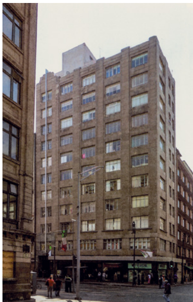
Aspecto actual del edificio sede de la Fundación Mier y Pesado, Juan Segura. Fotografía: 2020, CXGU. Fuente: Ibid. , p. 149.