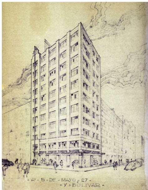
Copia heliográfica del edificio sede de la Fundación Mier y Pesado, Juan Segura, ca. 1934.