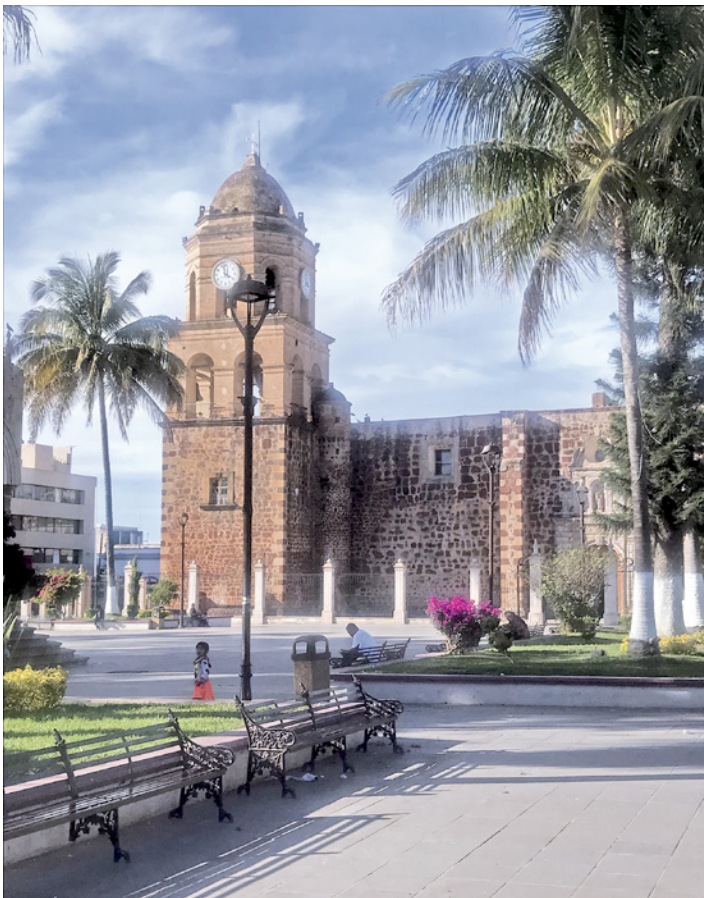
Figuras 2 a 4. La Romería Señorial Compostela en el Pueblo Mágico de Compostela en Nayarit, que tiene como propósito reactivar la economía del municipio con la llegada de los peregrinos; artesanos de la región ofrecen sus productos a turistas nacionales e internacionales. En la segunda imagen se puede ver al fondo la Parroquia de Santo Santiago Apóstol.

y pilar del diseño e implementación de acciones públicas que logran conjugar la difusión turística unida al patrimonio como proyecto social, a partir de estrategias de impulso al desarrollo local, y de protección y recuperación de la identidad (tomando en cuenta la integración económica y política que significó la consolidación de la Unión Europea), así como al fortalecimiento de sus enlaces productivos desde un horizonte de áreas territoriales diversificadas. En este sentido, el país gallo cuenta con una oferta patrimonial que es gobernada desde una visión de promoción de la autenticidad de lo local, bajo un orden de economía social y solidaria, la cual requirió incrementar y enlazar recursos propios, potencializar los valores tangibles e intangibles de sus sitios patrimoniales ubicados en pequeñas provincias para poder cubrir la demanda turística de manera eficaz, sin sacrificar las condiciones sociales de la población, por lo que se consolidó un modelo económico turístico sostenible gestionado por actores locales.