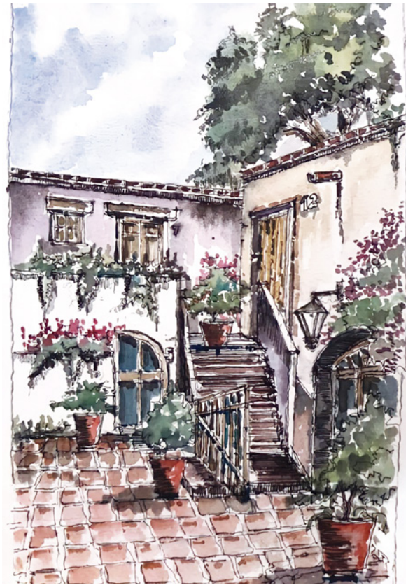
Figura 15. Pueblo Mágico San Sebastián Bernal, Querétaro. Ilustración: Gustavo García Balderas.