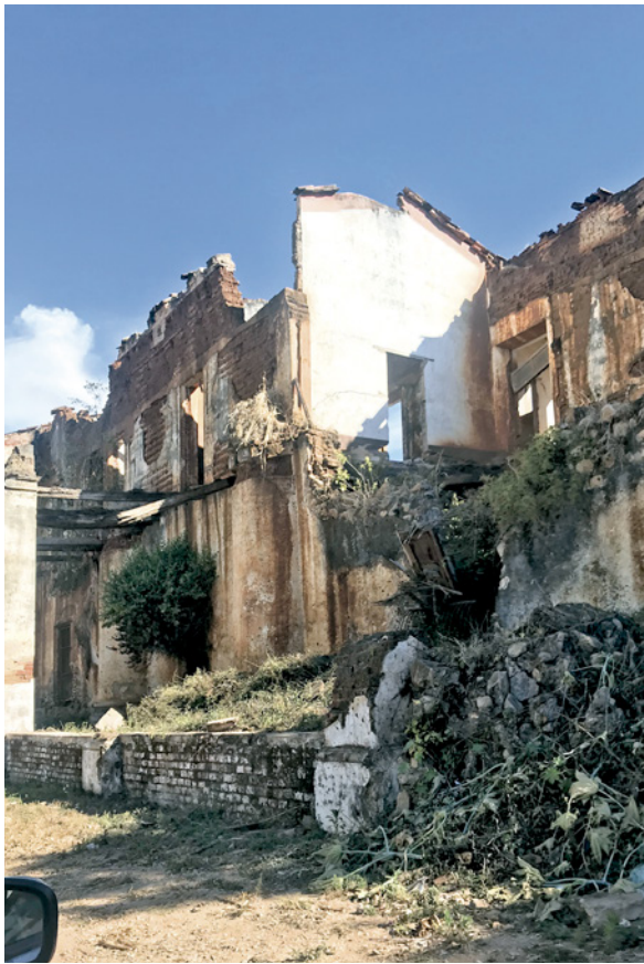
Figuras 9 y 10. Ruinas de la Ex Hacienda de la Condesa Miravalles, la cual posee una soberbia arquitectura realizada por la fineza de sus detalles ornamentales. Pueblo Mágico Compostela, Nayarit.