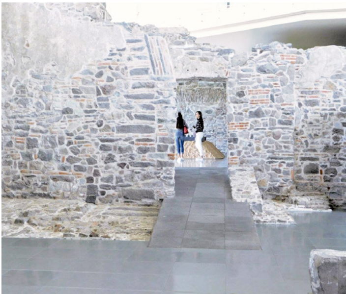
Figuras 17 a 19. Fuerte de Guadalupe en la histórica ciudad de Puebla, declarado como patrimonio histórico de México. Para su conservación y reutilización debió ceñirse estrictamente a la naturaleza propia del edificio y a su catalogación como Monumento Histórico, determinada por el INAH, rematando en la adición contemporánea, cuya integración física y visual con la plaza principal y sus componentes cierra un ciclo de respeto y pertenencia.