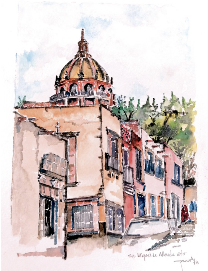
Figura 1. San Miguel de Allende, Guanajuato. Ilustración: Gustavo García Balderas.

La oferta de ideas, planes, proyectos y programas se consolida desde agendas de dimensiones locales, estatales, federales como multilaterales, todas ellas preocupadas por atender una serie de dilemas sociales sobre la conservación cultural y las carencias sociales, los déficits productivos y la conservación del medio ambiente, las identidades locales y la gestión del desarrollo de proyectos turísticos en un entorno delineado por una dinámica extractiva y de dependencia. 2 En este sentido, la herencia patrimonial, como actividad económica en la era de la globalización, expresa diversos retos multidimensionales que exigen integrar la conceptualización de la protección, la promoción de la diversidad de las expresiones culturales pero, sobre todo, posicionar el enfoque de desarrollo