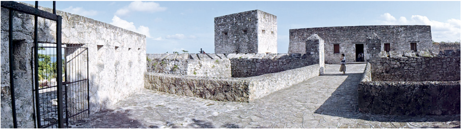
Figuras 15 y 16. Fuerte de San Felipe Bacalar, en el estado de Quintana Roo, fue adaptado como museo y declarado Patrimonio Histórico Nacional en 1965. Representa la conjunción de lo austero con lo funcional, el encuentro de la sobriedad y la elegancia.

empleos, disciplinas y necesidades del entorno local que permitan integrar tanto a los institutos formativos como al sector empresarial. La integración de la formación dual a las actividades patrimoniales permite incluir formas sistematizadas de aprendizaje que pueden ser aprovechadas por los sectores empresariales (locales), con el acompañamiento especializado de saberes y conocimientos aplicados.