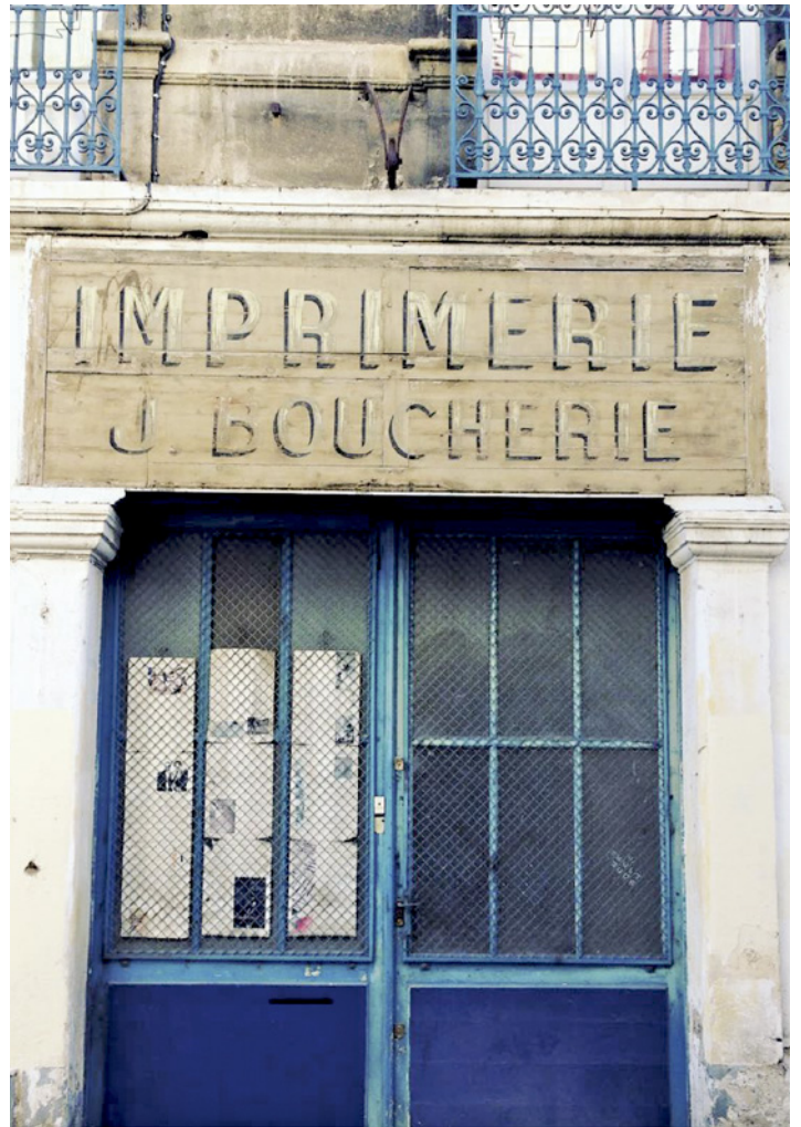
Figura 17. Tienda "Imprimerie" fundada en 1958 ubicada en el Barrio de Sainte Croix, de Bordeaux, Francia.

Por otro lado, como se ha analizado a lo largo del presente texto, las formas de gestión cultural visible en los diseños de políticas públicas son quizás un elemento esencial para edificar un nuevo proyecto que sume estrategias para articular y potencializar la promoción, la difusión, la sostenibilidad y conservación de los bienes culturales y patrimoniales desde una orientación educativa y productiva. Es por ello que el papel de la gestión de la economía de la cultura y su proceso valorativo, conlleva no sólo a considerar la demanda de los servicios, sino también a pensar cómo se construye la oferta bajo una vinculación con el capital humano (promoción de empleos dignos, capacitación del capital humano, las condiciones aptas de trabajo, así como la formación local y su articulación con las unidades locales productivas).