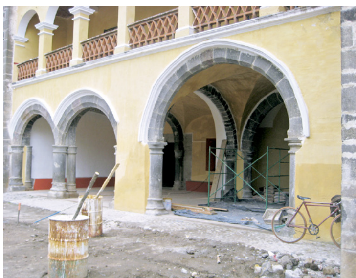
Figuras 5 y 6. Trabajos de mantenimiento en el Ex Convento de San Andrés Calpan, nombrado como Patrimonio Cultural de la Humanidad por la Unesco en 1995.

Los resultados monetarios para las pequeñas poblaciones que integran los llamados Pueblos Mágicos (PM) en 2014, correspondieron a 7.8% del total de las unidades económicas con actividades turísticas, teniendo 2.4% del valor agregado bruto turístico (es decir, cerca de 10 292 millones de pesos) en estos territorios patrimoniales catalogados. En términos de ocupación, la oferta productiva de los PM generó cerca de 117 972 empleos, equivalente a 4.3% del total turístico. Por otro lado, al hablar de la desagregación por sector económico, la participación del comercio al por menor en el valor agregado turístico representó 58.5%, mientras que el sector de servicios de alojamiento temporal y de preparación de alimentos y bebidas participó con