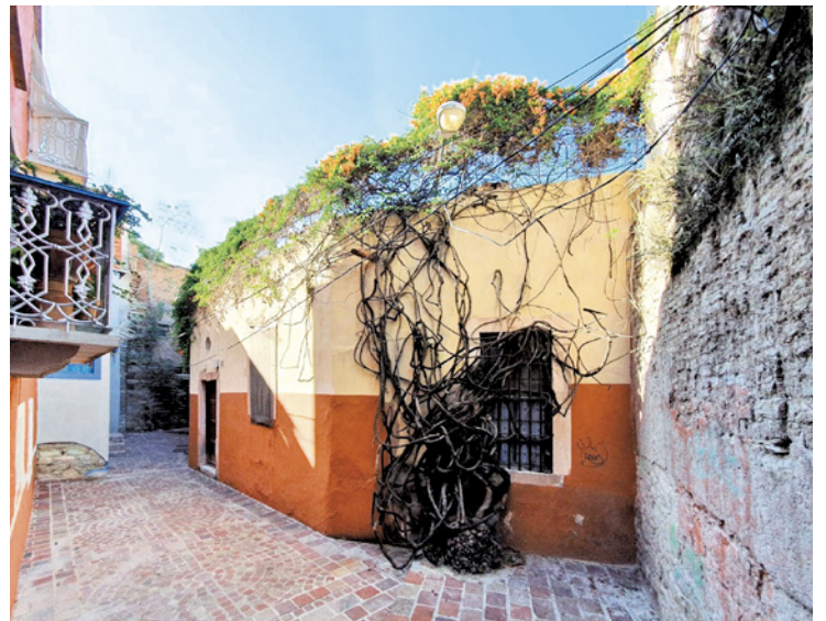
Figuras 11 a 14. Ciudad de Guanajuato, reconocida en 1988 como Patrimonio Cultural de la Humanidad por la UNESCO, por su belleza y trayectoria histórica.