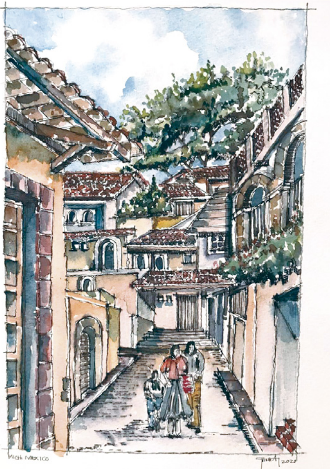
Figura 16. Población del Estado de Michoacán. Ilustración: Gustavo García Balderas.