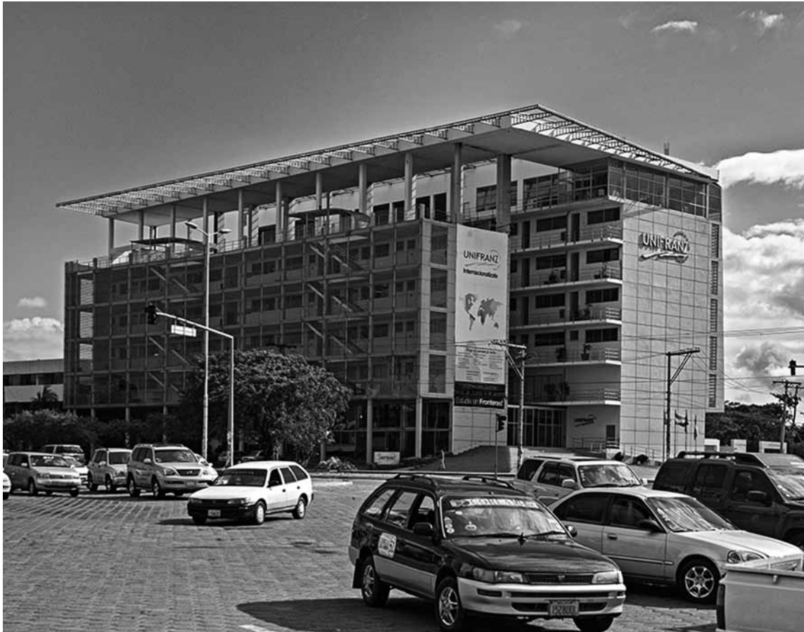
Figura 8 Bloque de UNIFRANZ.