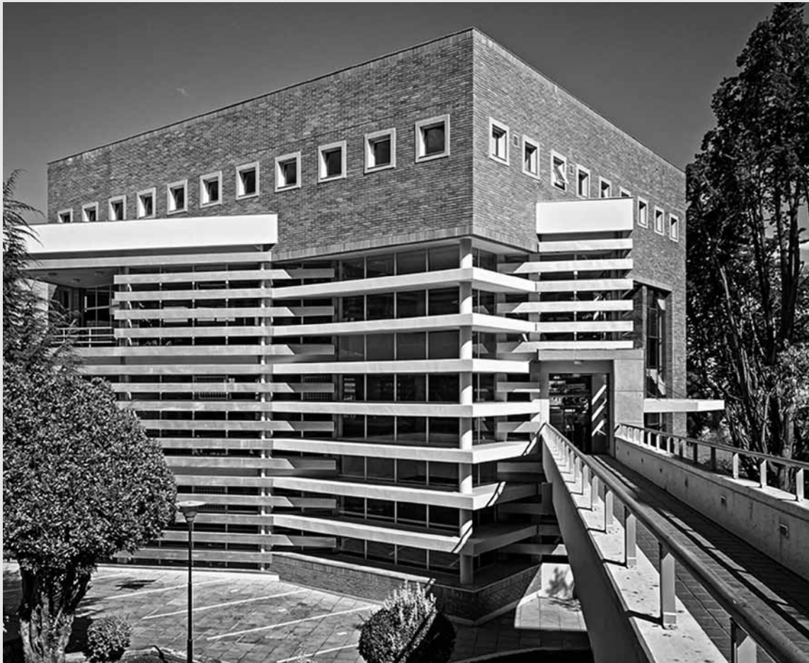
Figura 16 Biblioteca de la Universidad Católica Boliviana.

ciones privadas. Al respecto, destaca el caso de la construcción de edificios para algunas universidades privadas, por ejemplo los que se encuentran en el campus de la Universidad Católica Boliviana “San Pablo”. Por un lado está la biblioteca del arquitecto Ramiro Muñoz, quien utilizó ladrillo y concreto para generar un edificio monumental, mismo que complementa la actividad educativa del campus. Por otro lado está el café, diseñado por el arquitecto Daniel Contreras, quien con madera, metal y vidrio propuso un agradable espacio de encuentro y pausa en cuanto a las actividades académicas. La crítica en contra es que los dos edificios, divergentes en cuanto a sus respuestas formales, hacen parte del mismo conjunto pero no se relacionan entre sí. Son dos entes independientes que no armonizan, lo cual convierte al campus en una collage de edificios. Sin duda ahí existen buenas calidades constructivas y espaciales, pero no constituyen una unidad. Y esto es una clara muestra de lo que pasa en el resto de la ciudad con la arquitectura reciente.