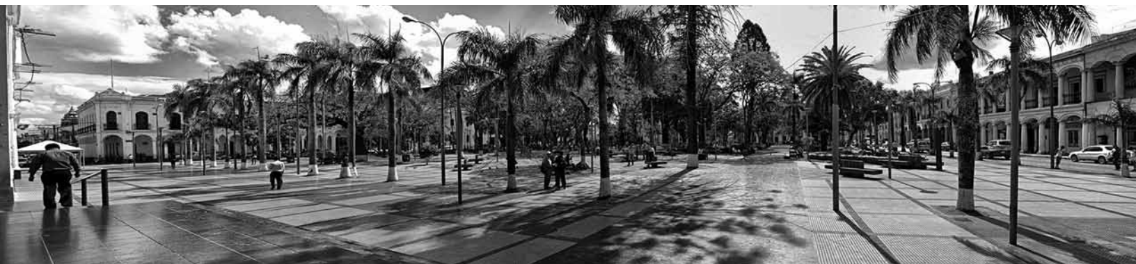
Figura 13 Plaza 24 de Septiembre.

la catedral (manzana 1), en el costado sur, ello a través de la peatonalización de las calles Ayacucho, la cual se convirtió en parte del atrio de la catedral, y la calle Junín, misma que ahora es el acceso a la alcaldía.