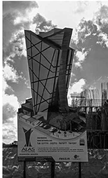
Figura 11 Render edificio nuevo.