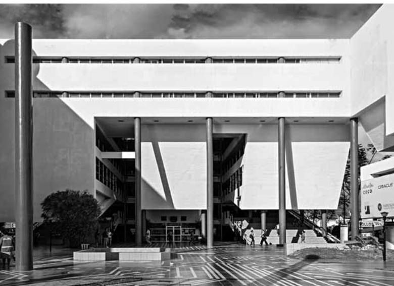
Figuras 5, 6 y 7 Bloque principal; Escalera del Bloque y Patio central y Bloque principal.

identificado ante todo con el contexto de la globalización y han buscado incorporarse a los esquemas internacionales. Tal postura obedece lo mismo a la imposición del cliente que a la tendencia particular de algunos profesionales que aducen no sentirse identificados con los discursos locales que se originan al interior del país, y que a la vez comparten afinidades con los discursos arquitectónicos de los países vecinos. Bajo este esquema es que se va imponiendo la conformación en un tercer anillo, más amplio que los otros, compuesto principalmente por una serie de equipamientos educativos recientes, mismos que, en lo general, responden también a modelos formales foráneos. Tal es el caso de la Universidad Técnica Privada de Santa Cruz, del arquitecto Hans Kenning Moreno, quien diseñó este campus dando cauce a su visión personal sobre lo que “debe ser” la academia, en conjunción con la idea del cliente, el cual buscaba causar un impacto sobre la imagen de la escuela privada de educación superior.