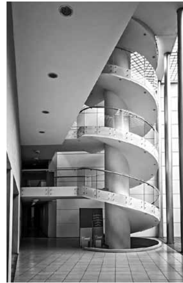
Figura 20 Escalera edificio nuevo.

Afortunadamente, mostrando diferencia en cuanto a intenciones, puede citarse, por ejemplo, la rehabilitación y construcción del nuevo edificio para el Museo Nacional de Etnografía y Folklore, realizado por el arquitecto Carlos Villagómez. Este proyecto adecua las instalaciones de una casa colonial para recibir salas de exposición y además adiciona un edificio al conjunto, pero este, aunque excede la altura de las construcciones coloniales de la zona, se mantienen neutro al ser un elemento blanco que se levanta