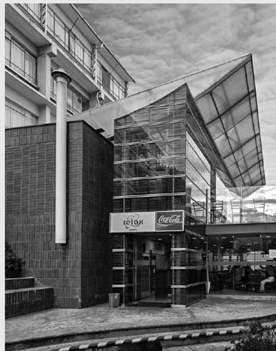
Figura 17 Café.

ciones privadas. Al respecto, destaca el caso de la construcción de edificios para algunas universidades privadas, por ejemplo los que se encuentran en el campus de la Universidad Católica Boliviana “San Pablo”. Por un lado está la biblioteca del arquitecto Ramiro Muñoz, quien utilizó ladrillo y concreto para generar un edificio monumental, mismo que complementa la actividad educativa del campus. Por otro lado está el café, diseñado por el arquitecto Daniel Contreras, quien con madera, metal y vidrio propuso un agradable espacio de encuentro y pausa en cuanto a las actividades académicas. La crítica en contra es que los dos edificios, divergentes en cuanto a sus respuestas formales, hacen parte del mismo conjunto pero no se relacionan entre sí. Son dos entes independientes que no armonizan, lo cual convierte al campus en una collage de edificios. Sin duda ahí existen buenas calidades constructivas y espaciales, pero no constituyen una unidad. Y esto es una clara muestra de lo que pasa en el resto de la ciudad con la arquitectura reciente.