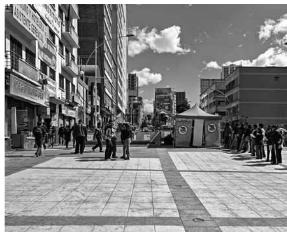
Figuras 22, 23 y 24 Avenida Villazón, Bloque UMSA y Plaza Bicentenario.