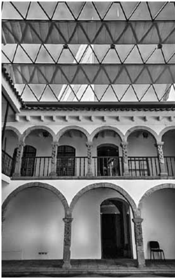
Figura 18 Patio de casa tradicional, hoy convertida en museo.