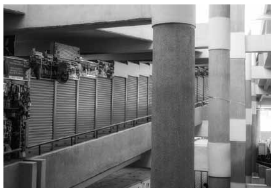
Figuras 29 y 30 Mercado Lanza.