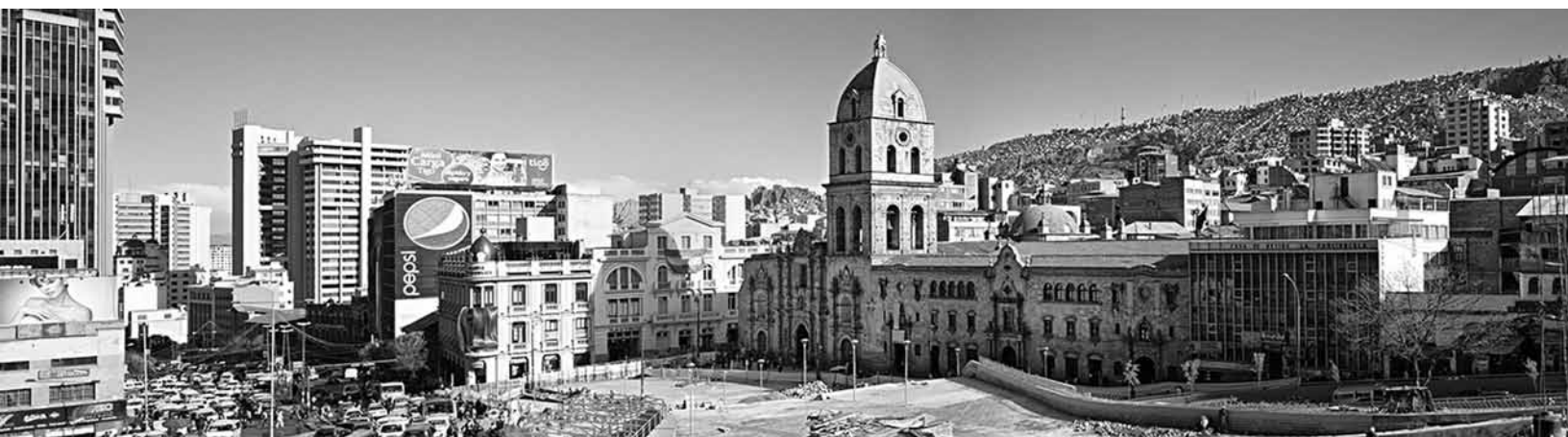
Figura 28 Construcción PLaza San Francisco.

Héroes, al norte de esta, con lo cual se consolidó una amplia explanada que recibe a los cientos de usuarios del mercado Lanza, la calle del comercio y de la propia iglesia.