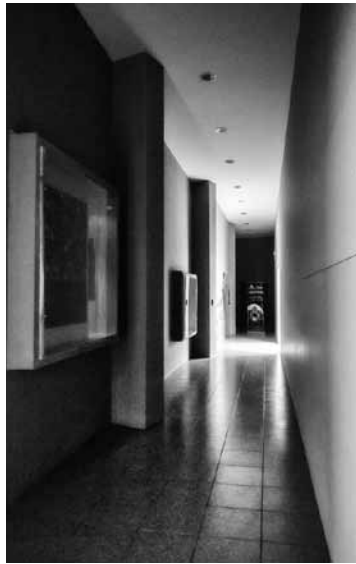
Figura 19 Nuevo edificio, hoy convertido en museo.