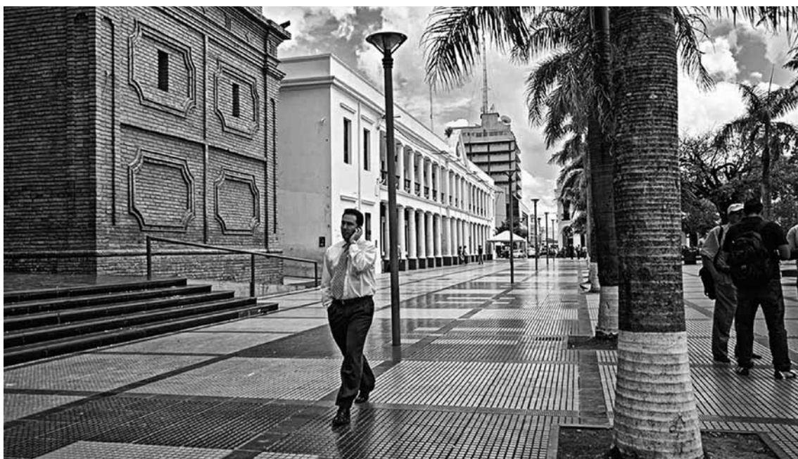
Figura 14 Peatonalización de la calle Ayacucho.

extendiéndose hasta casi conformar un séptimo anillo, el cual no termina aún de consolidarse, ni hacia el occidente ni hacia el norte de la ciudad. Las consideraciones sobre la forma de crecimiento de esta ciudad son importantes, ya que es una localidad que ha aumentado su población de manera vertiginosa. Se ha presentado, entonces, un crecimiento desordenado de la urbe en el que perviven tanto el trazo del damero tradicional como el despliegue urbano propuesto por el plan Techint. En las zonas sur y oriente se han consolidado los barrios dormitorio, cuyos desarrollos obedecen a una simbiosis de los dos sistemas mencionados, y que han surgido como respuesta a la masiva migración hacia la región.