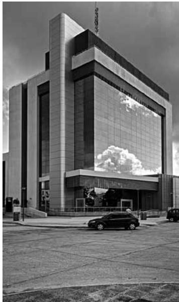
Figura 10 Edificio ITC Tower.