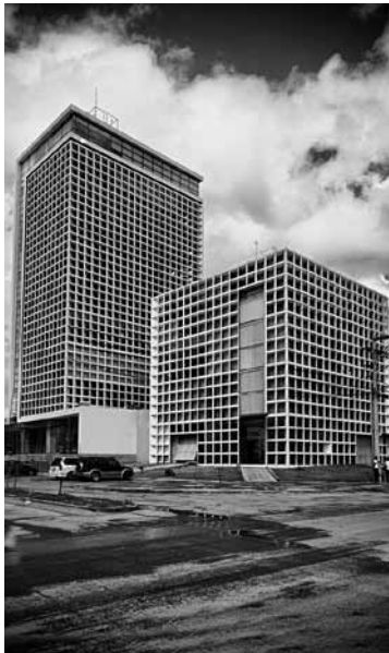
Figura 9 Edificios Cubo.