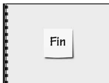
Figura 1 Ejemplos de algunas de las diapositivas del podcast de video.