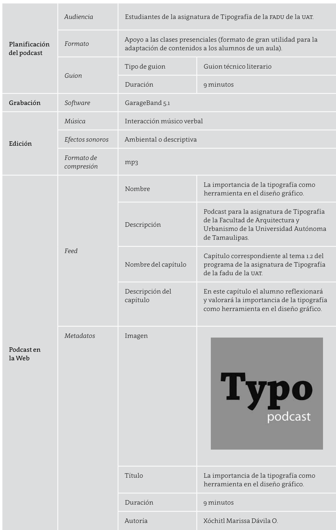
Tabla 1 Ficha técnica del podcast de audio.