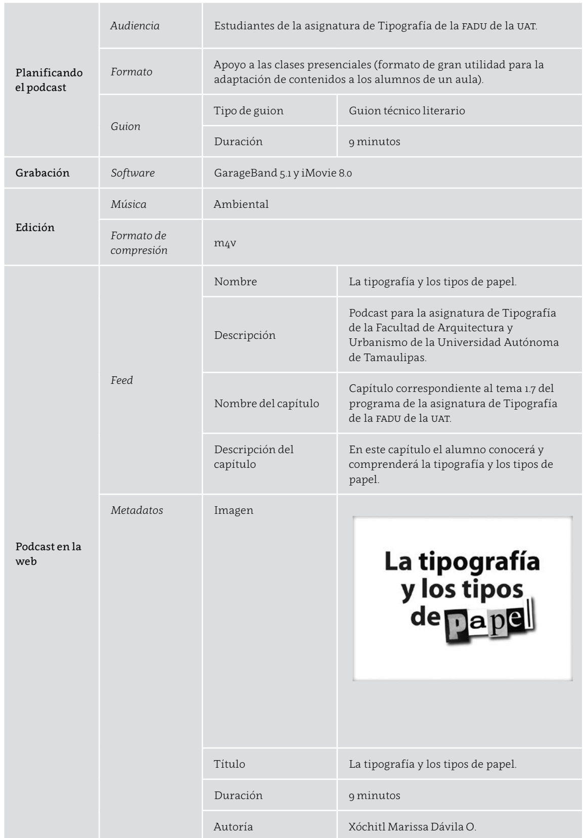
Tabla 2. Ficha técnica del podcast de video.